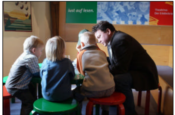
Lesen für die Kleinsten...

Es hat mir großen Spaß gemacht, meine 3-5jährigen Zuhörer mit dem Buch „Zilly, die Zauberin“ von Korky Paul und Valerie Thomas zu unterhalten und hoffe, bald wieder Gelegenheit zu einem solchen Termin zu bekommen.