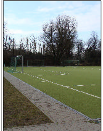
10 Milliarden für die Kommunen: Auch der Sport kann profitieren.

Gerne stehe ich für weitere Informationen und bei der Vermittlung von Ansprechpartnern zur Verfügung.