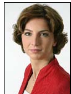
Drogenbeauftragte Sabine Bätzing

Aula der Polizeidirektion Biberach, Erlenweg 2